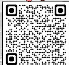
日本ファブテック