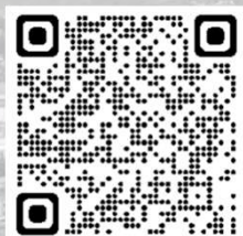
社員インタビュー